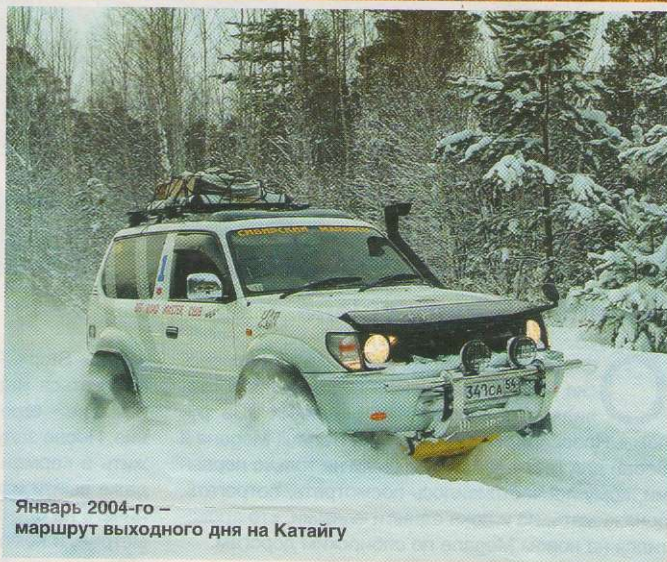
Январь 2004-го – маршрут выходного дня на Катайгу