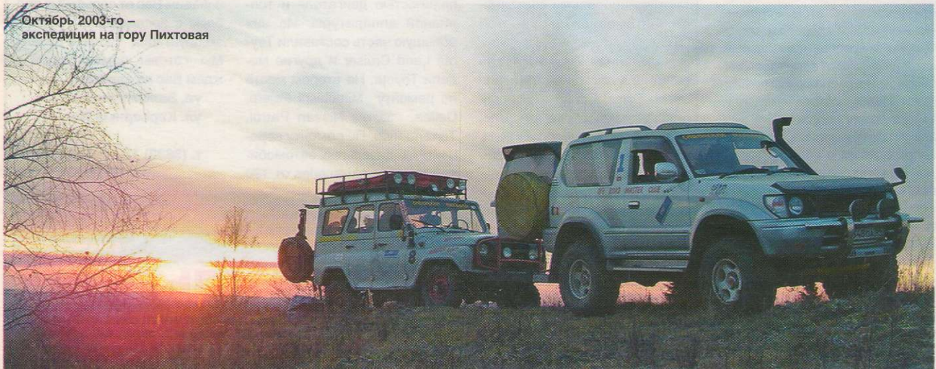
Октябрь 2003-го – экспедиция на гору Пихтовая

– У нас все мероприятия авантурные: разведки не проводятся. «Сибирский марафон» – это не «Кэмел-трофи». Хотя пока все наши авантюры хорошо заканчивались. Мы проехали, преодолели все маршруты, которые планировали, еще ни разу так не получилось, чтобы мы развернулись и уехали ни с чем. А самая интересная и самая серьезная экспедиция – это первопрохождение вдоль старинного Обь-Енисейского водного пути. От Колпашева и четко на восток вдоль рек Еть, Ломоватая, через тайгу и дальше вдоль реки Касс с выходом на Енисей, в село Ярцево. На этом участке более 100 лет назад строилась водная магистраль. Вдоль всего этого канала существовал так называемый Баронский тракт, и изначально, когда не было железной дороги, все движение в Сибири по направлению запад – восток осуществлялось именно по этой магистрали. Она работала, но 120 лет назад все это дело забросили. Последние теплоходы проходили по водной магистрали в 1942 году. Берингово море было заминировано, и из Енисея в Обь протаскили три парохода и один газход. Это была героическая акция, люди буквально полгода боролись – копали, выпиливали завалы. Мы, в принципе, делали то же самое. Только шли не по воде, естественно. Протяженность маршрута 2,5 тыс. км, из них категорийный участок – от села Усть-Озерного до села Ярцево – 260 км. Нормальные люди там не ездят. Броды, болота, гать, построенная полтора века назад