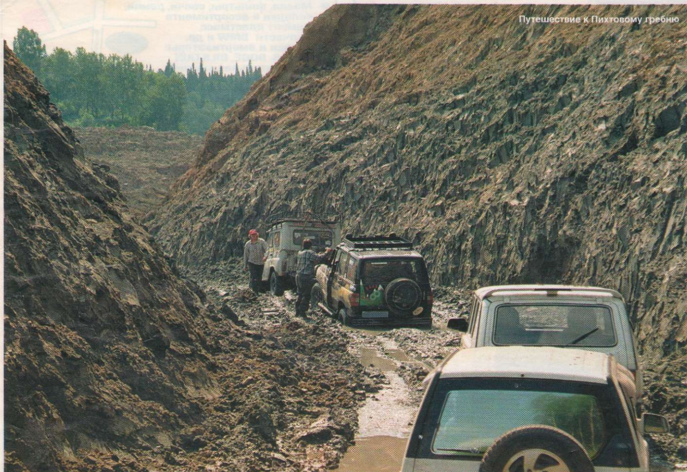
Путешествие к Пихтовому гребню